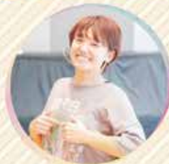
仲きに笑って「MAK(まき)さん」 みんなで楽しくダンス