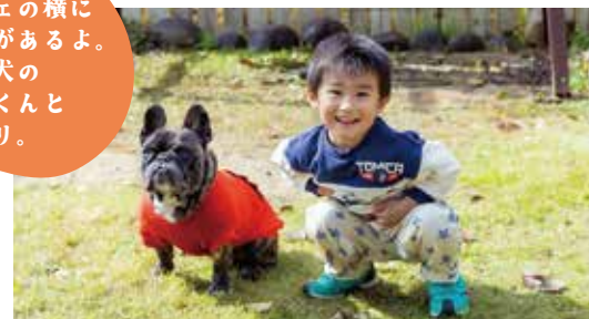
ロケ地：cafe ムムの森（朝来市）