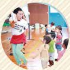
こどもの力をぐんぐん伸ばす マジックパパのふしぎ遊び