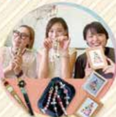
世界にひとつだけのあからもの「 手作りワークショップ」