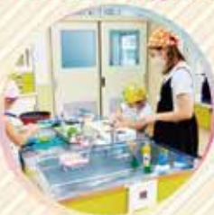
親子でできる「 親子クッキング」